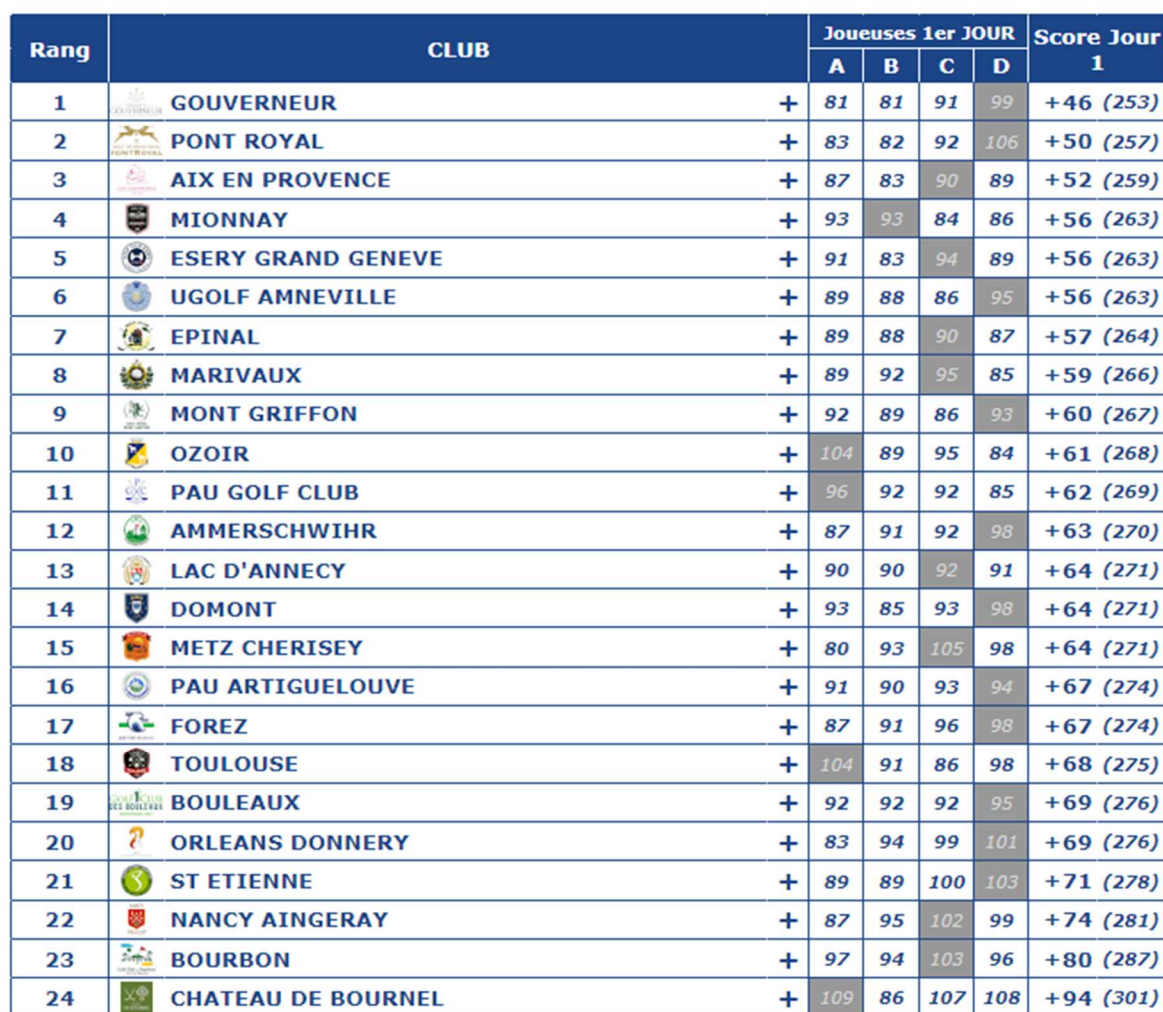
TABLEAU DE RESULTATS