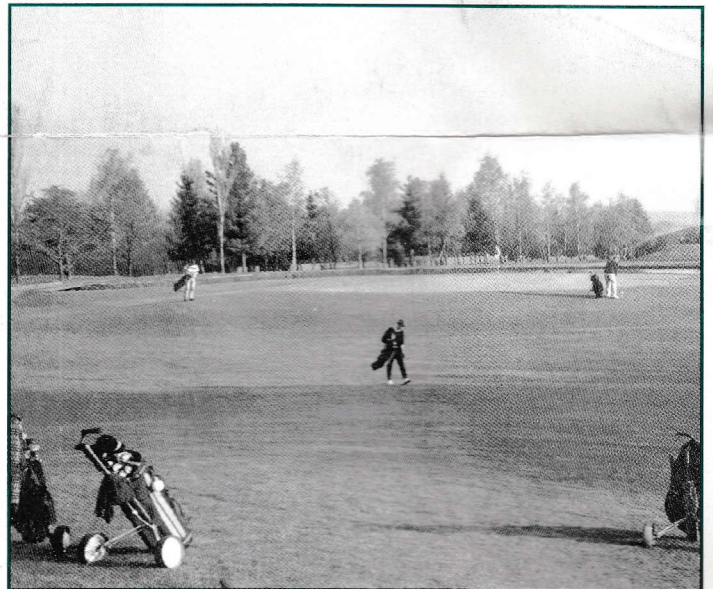
▲ Le green du 18