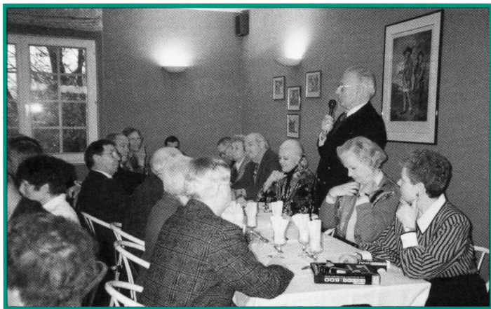
Galette des Rois - Seniors 2. Fev.95 Passation des pouvoirs ▲

Nous espérons que les Séniors seront animés d'un esprit de compétition identique à celui de leur dynamique présidente.