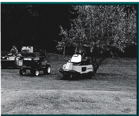
P. GRUNENBERGER - EXPRESSIONS