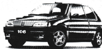
PEUGEOT 106. LA SURPRISE DE TAILLE. Modèle présenté : 106 XSI